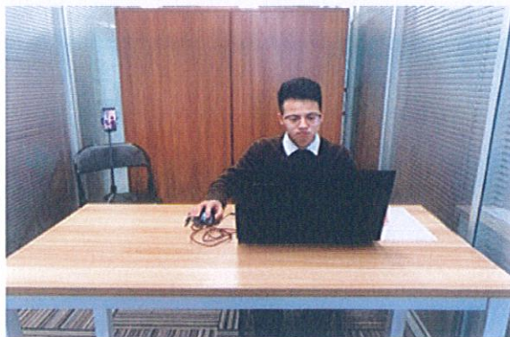
图一：电脑端正面视角

同时应在考生座位后侧面的合适位置放置移动端设备，保证移动端设备能够从后侧面拍摄到考生桌面、电脑屏幕、周围环境及考生考试全过程。