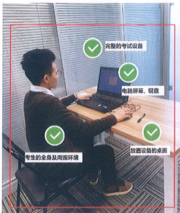
图三：佐证视频监控视角

五、模拟测试是考生发现电脑设备、移动设备端和网络环境是否存在问题的关键环节，模拟测试流程完全按照正式考试流程进行（具体流程见附件2），考生须熟悉考试系统和操作流程，保证设备、系统、网络等符合要求、运行正常。