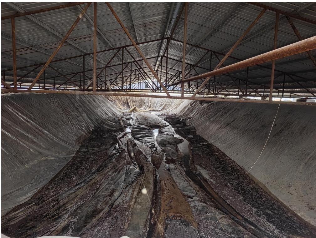
图 2 事故浆池

事故发生在存放原料玉米浆的 3#浆池，池长 54 米，宽 17 米，深 3 米。该池系 2024 年 6 月临时挖掘，池体未经硬化和防水处理，铺设塑料薄膜防止玉米浆渗漏。